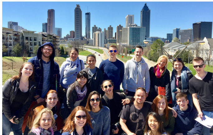
▲ Azubis vor der Skyline Atlantas